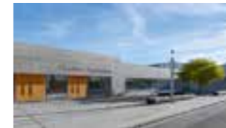
1 Goethe-Gymnasium, Regensburg