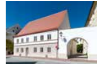
2 Kinderhort, Neuburg