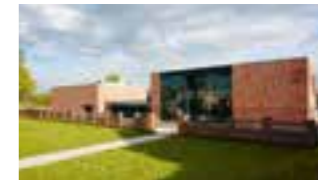
3 LLA, Triesdorf