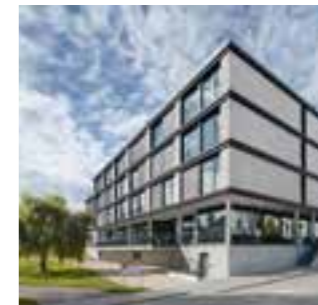
4 Hotel, Eichstätt