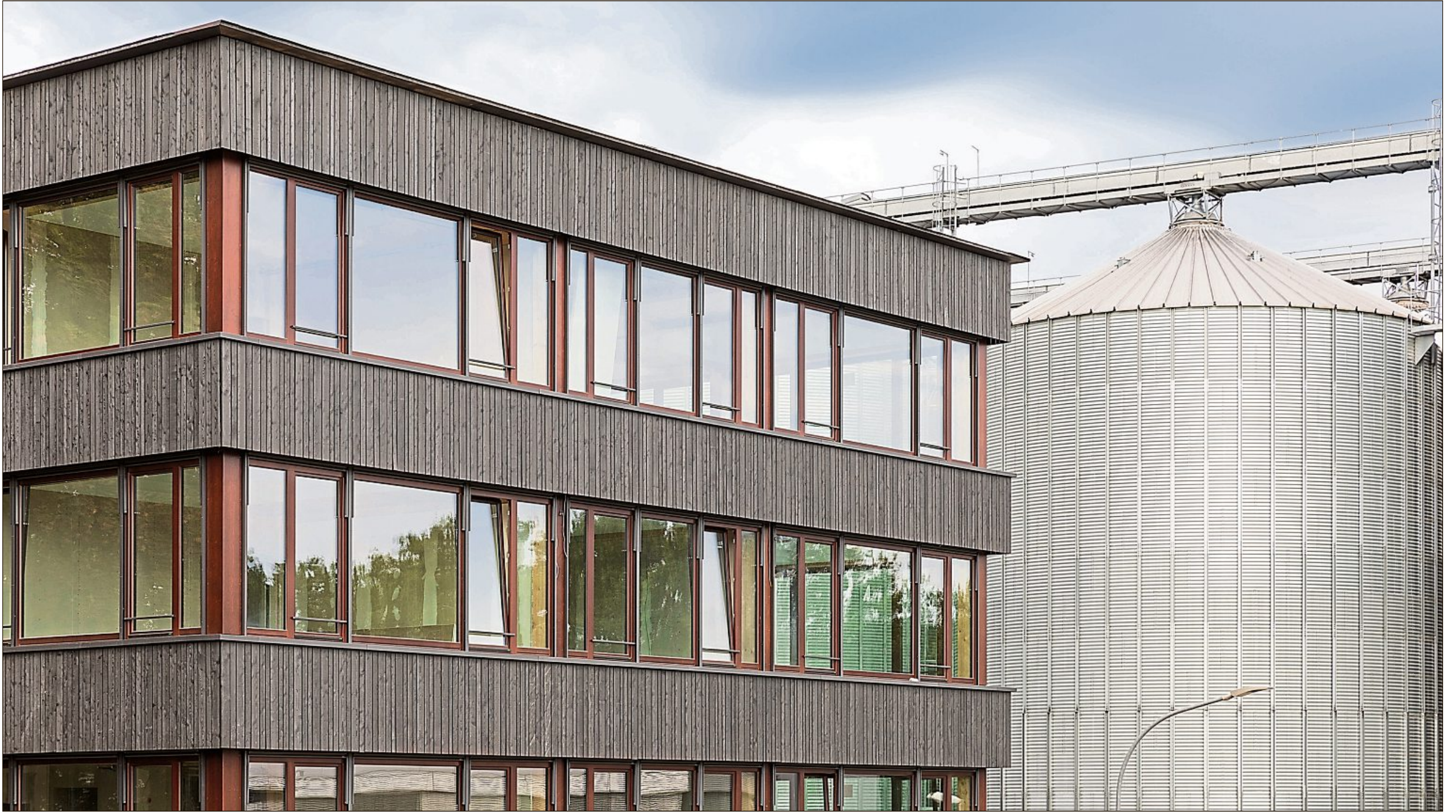
Das neue Bürogebäude liegt gegenüber von großen silbernen Silos.