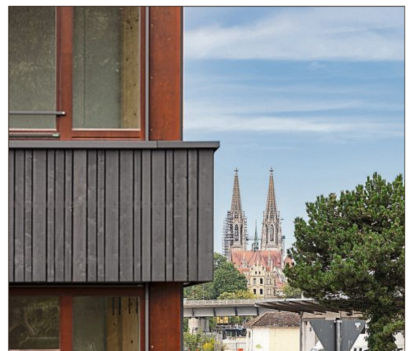
Der Blick auf den Regensburger Dom ist fantastisch.